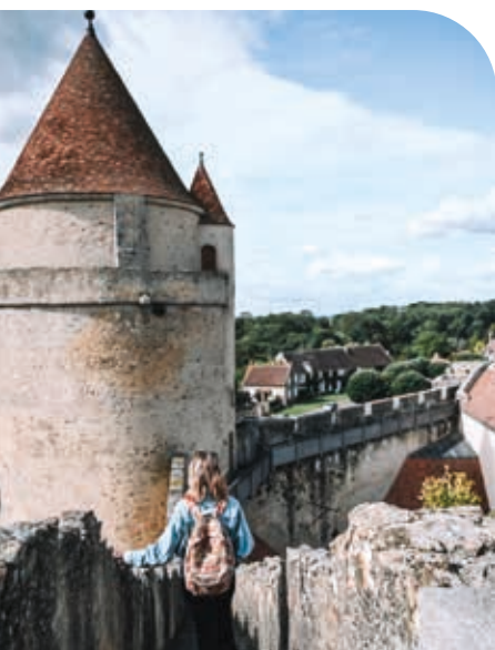
SCHÉMA DÉPARTEMENTAL D'AMÉNAGEMENT & DE DÉVELOPPEMENT TOURISTIQUE DE SEINE-ET-MARNE 2023 > 2028